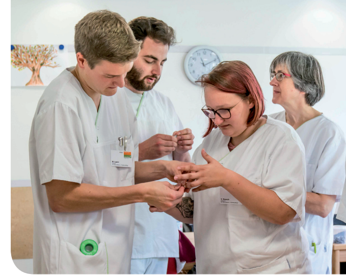
Zusammen lernen und arbeiten: Pflege ist Teamarbeit.

Die Lernenden werden bei der individuellen Erreichung der Ausbildungsziele durch Praxisanleiterinnen und -anleiter sowie Kontaktlehrerinnen und -lehrer begleitet.